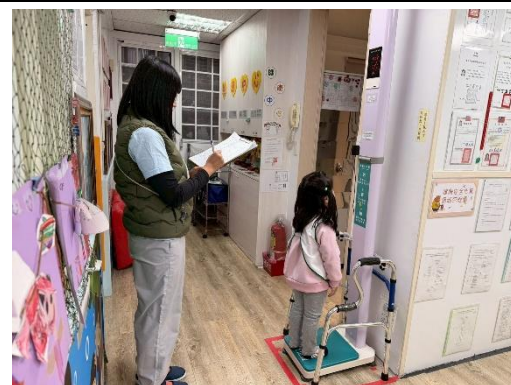
※恩慈班進行身高體重的測量。