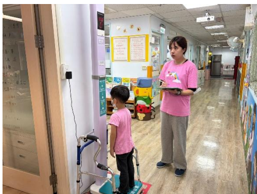
※良善班進行身高體重的測量。