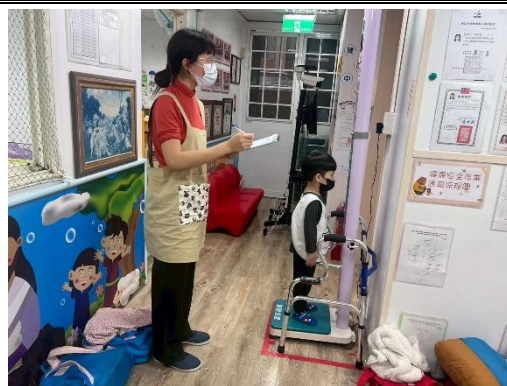
※溫柔班進行身高體重的測量。