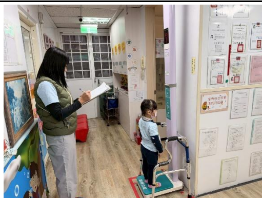
※恩慈班進行身高體重的測量。