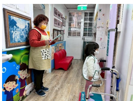
※喜樂 A 班進行身高體重的測量。