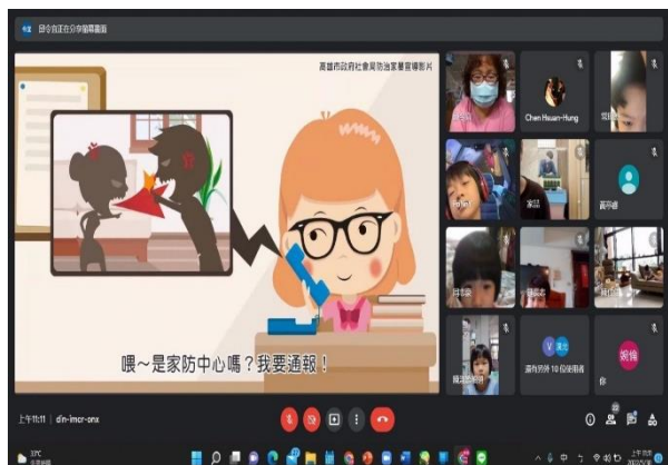
※目睹家庭暴力，應於 24 小時內打電話通報家扶中心，尋求協助以保護幼兒的安全。