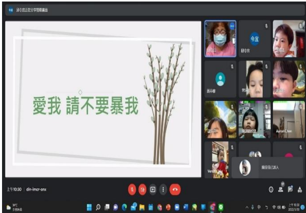
※老師與幼兒討論『愛我 請不要暴我』的定義。