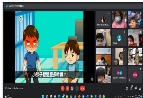
※影片欣賞：『如何面對家庭暴力』。 幼兒分享：受到家庭暴力一定要說出來。