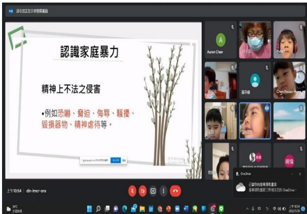
※家庭暴力可分為身體暴力和精神暴力。 方式有踢、推、拉、抓、揪頭髮…等方式。