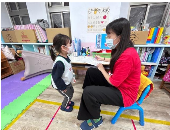
※ 3歲半幼兒進行測量