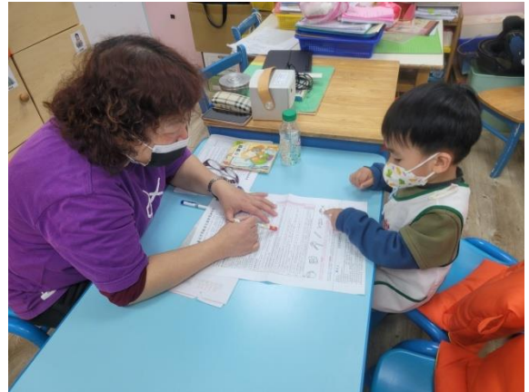
※ 2歲半幼兒進行測量