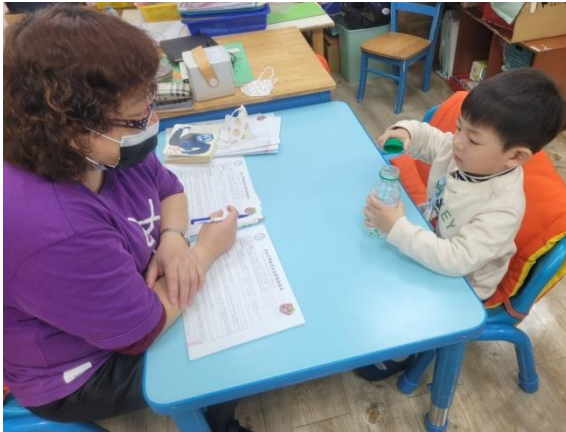
※ 2歲半幼兒進行測量