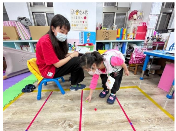
※ 4歲(新生)幼兒進行測量