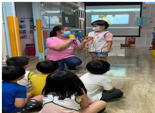
※我不隨便接受陌生人的東西。