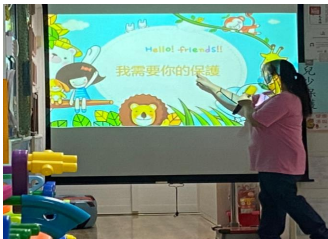
※老師向幼兒介紹何謂『兒少保護』。