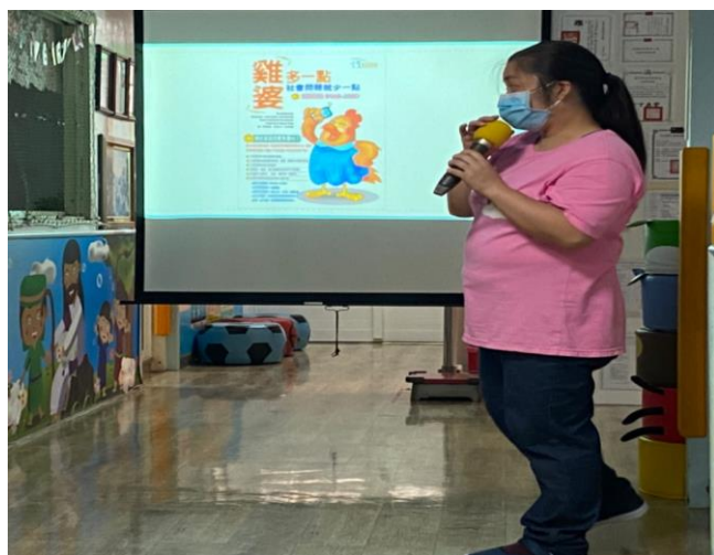
※多關心周圍需要幫助的幼兒。