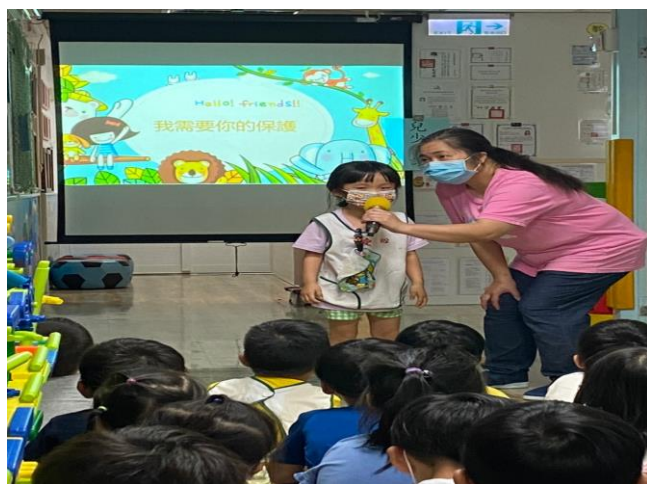
※幼兒分享：不要隨便跟陌生人講話。