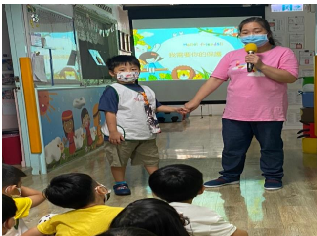
※外面有很多壞人，外出要和大人手牽手。