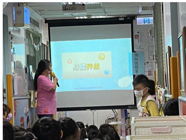
※利用影片介紹什麼是身體的界線。