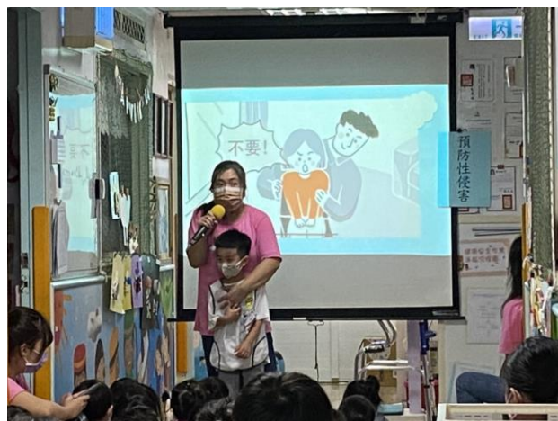
※別人亂摸我的身體時，我要大聲說不！