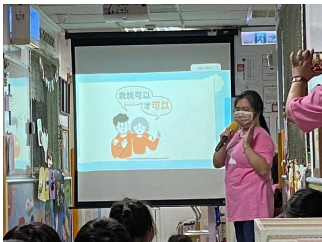
※經過別人同意，才可以有身體接觸！