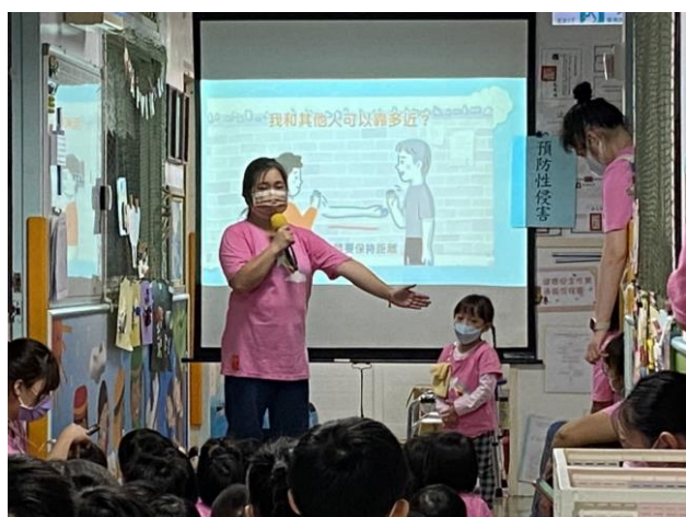
※示範：我和其他人可以靠多近。