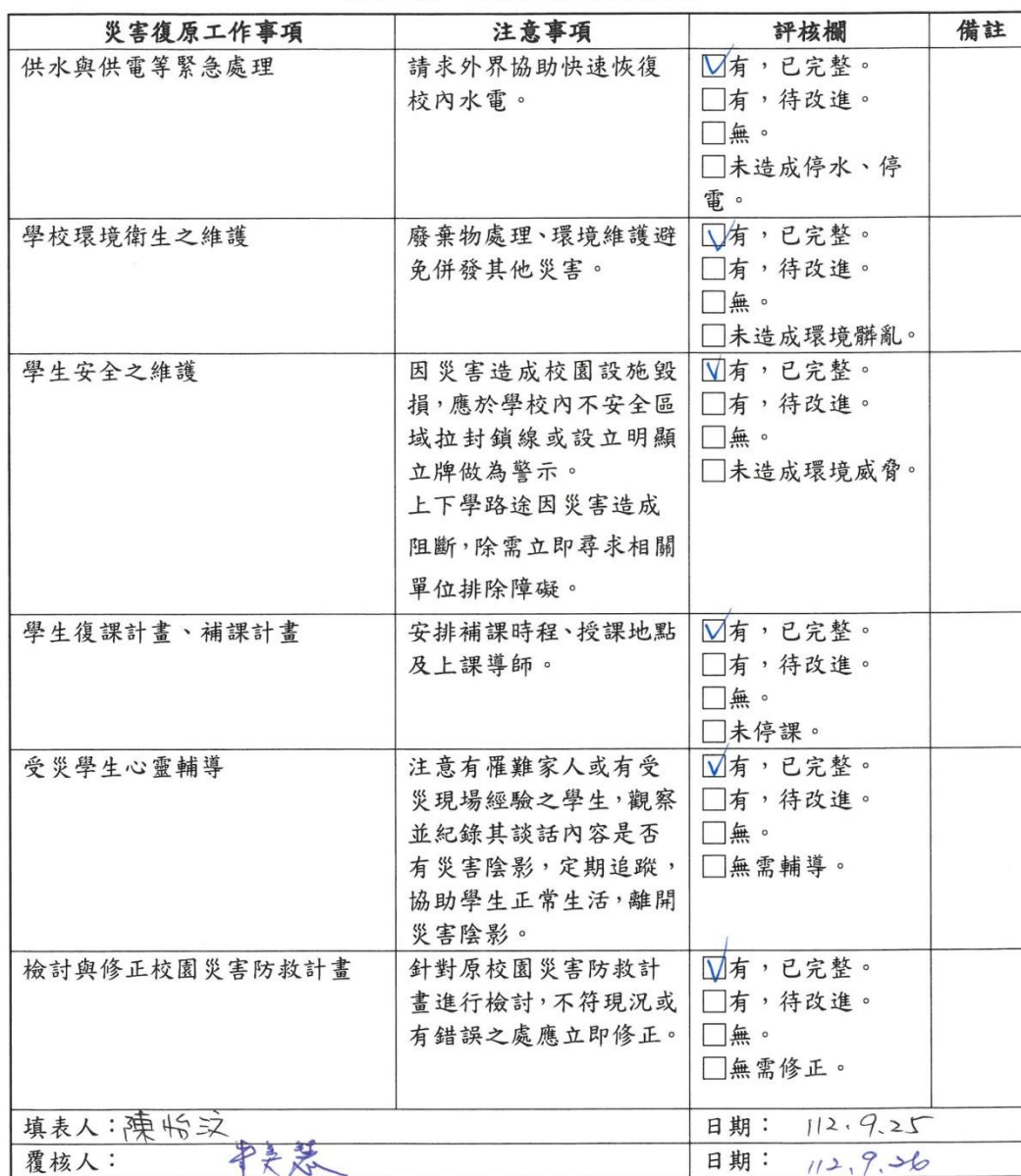
附表 1.5 校園災後復原檢核表