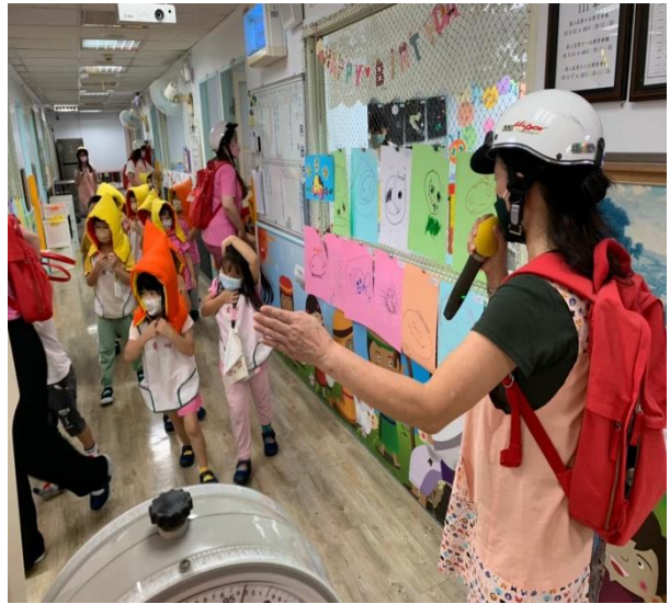
不跑、不推、不語疏散至戶外到安全集結點地區