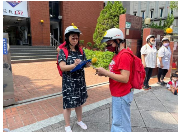
回報指揮官教職員生人數