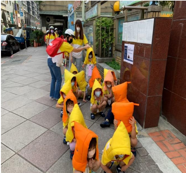
盤點各班幼童人數