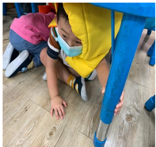
趴在桌子底下作掩護