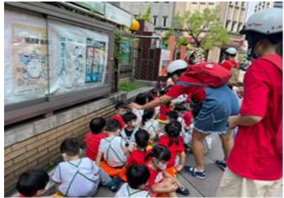
盤點教職員工與幼生人數