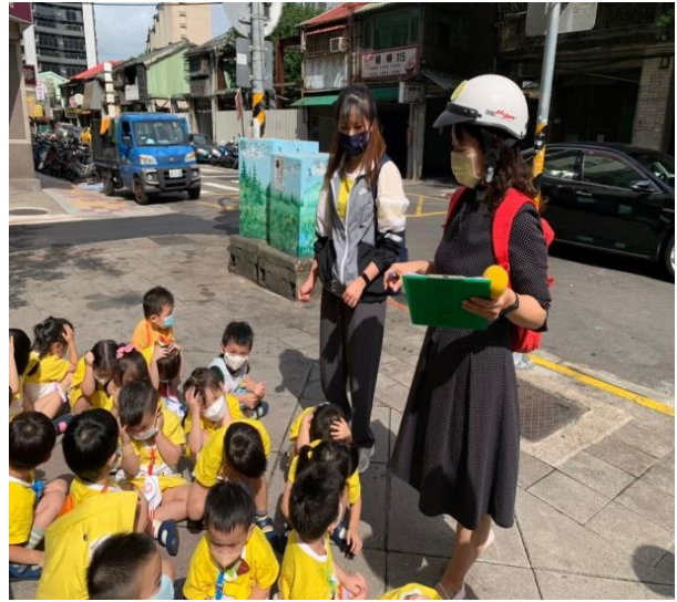
回報指揮官(園長)教職生人數