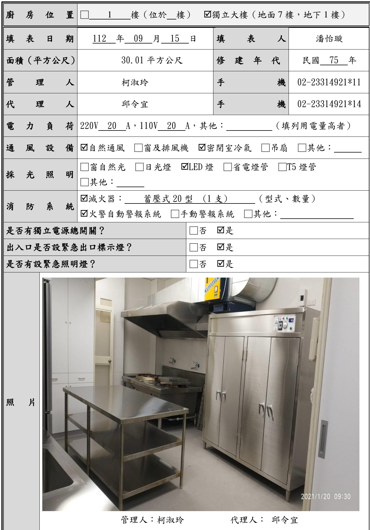
表 2.3 廚房現況資料表