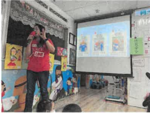
宣導疏散三不原則 - 不語、不推、不跑。