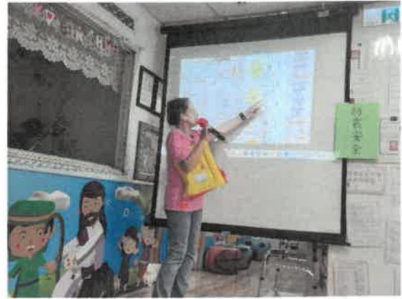
老師介紹校園防災地圖。